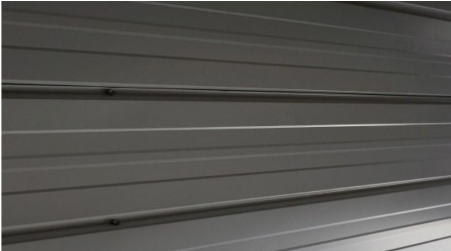
MS 750 I